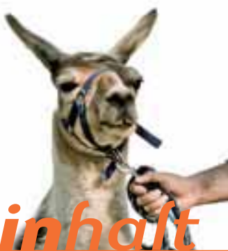
Kein Alltagstrott mit Lamas

Weitere Infos finden Sie im Internet unter: www.badeparadies.de www.walkemuehle-goettingen.de